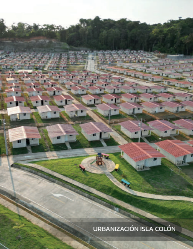
URBANIZACIÓN ISLA COLÓN