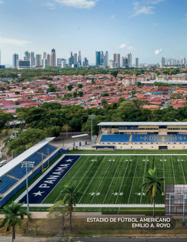
ESTADIO DE FÚTBOL AMERICANO EMILIO A. ROYO