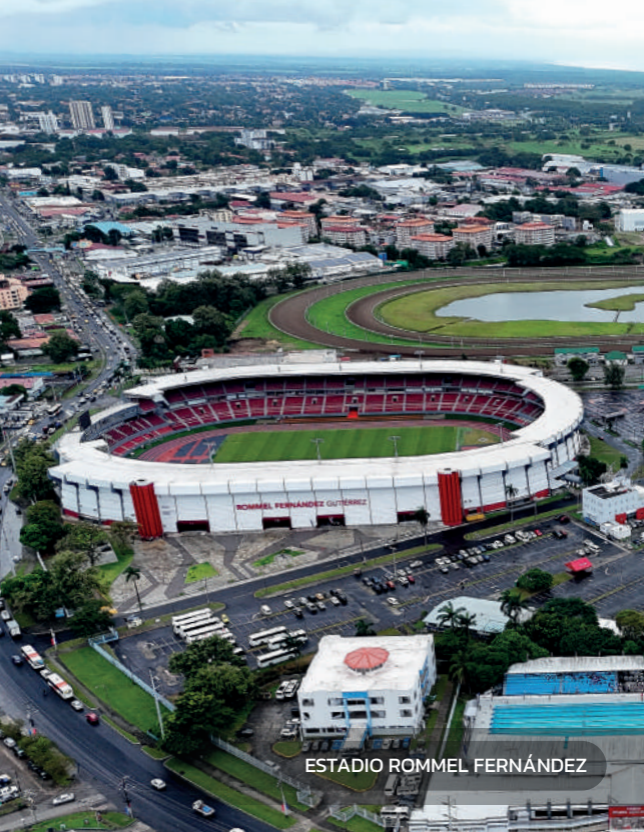
ESTADIO ROMMEL FERNÁNDEZ