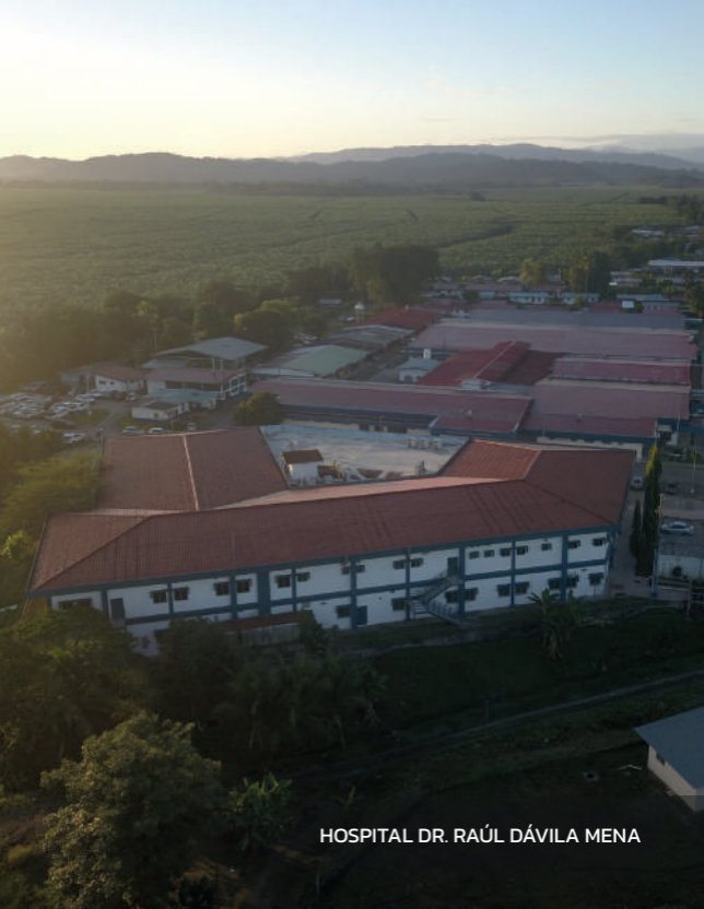
HOSPITAL DR. RAÚL DÁVILA MENA