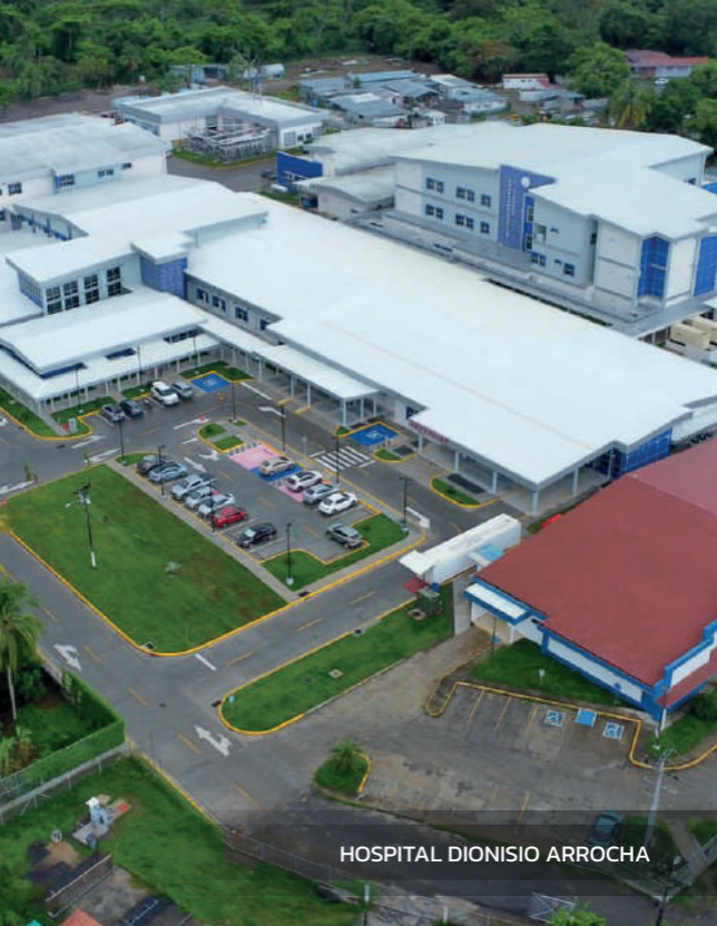
HOSPITAL DIONISIO ARROCHA