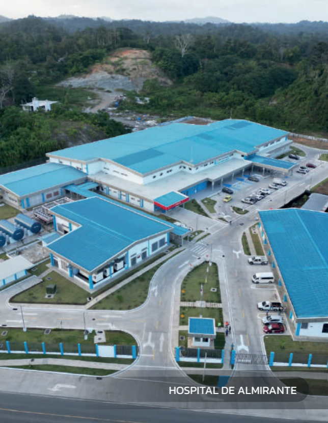
HOSPITAL DE ALMIRANTE