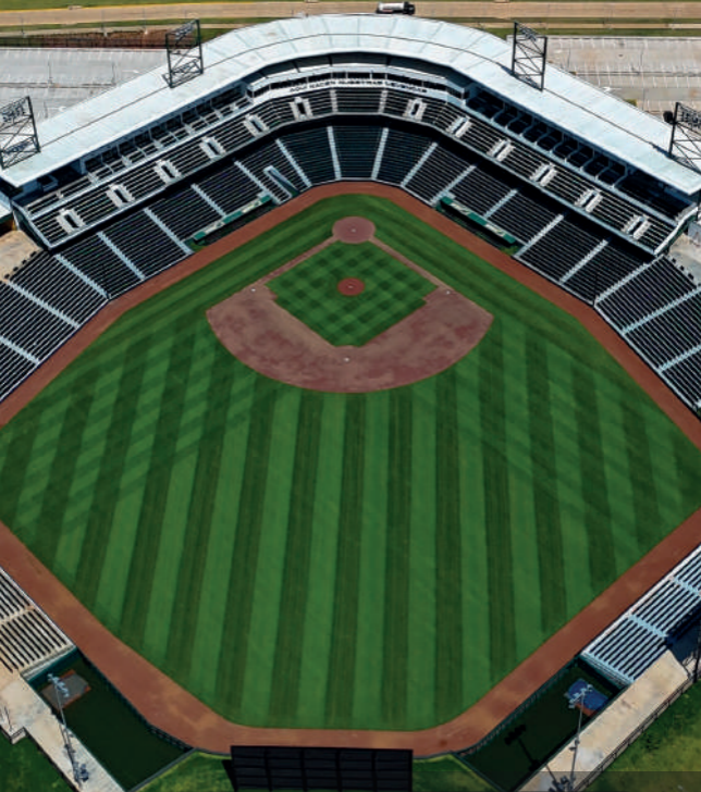
ESTADIO DE BÉISBOL MARIANO RIVERA Y CENTRO DE ALTO RENDIMIENTO DE BÉISBOL NACIONAL