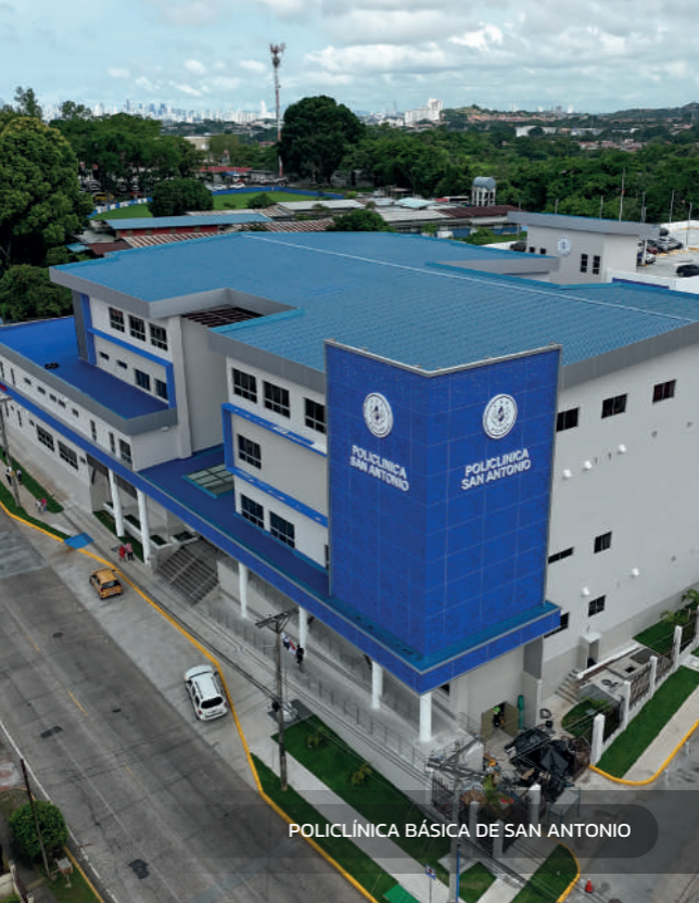
POLICLÍNICA BÁSICA DE SAN ANTONIO